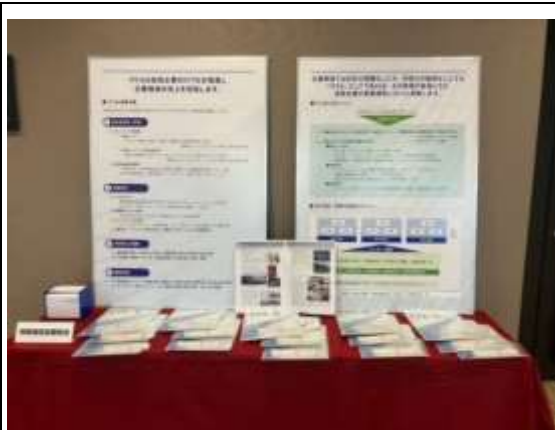
協会ブースの様相

協会ブースにも約50名の来場者が訪れ、機関誌「ITCA」や入会メリット、関東地方本部の活動内容をまとめた入会勧奨用パンフレットを配布し、積極的な入会勧奨を行いました。