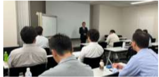
<法規コースの研修模様>