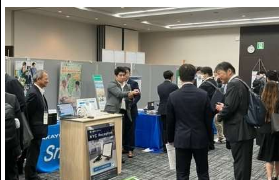
ブースを見学するお客様1