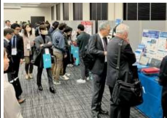
ブースを見学するお客様2