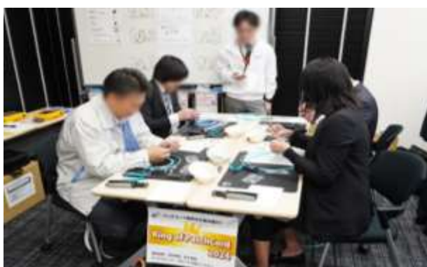
CAT6 パッチコード成端 選手権会場