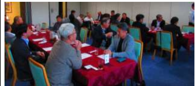
<表彰式を待つ選手>